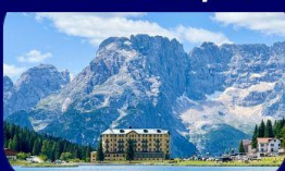
อุทยานฯ โดโลไมท์