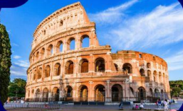
เที่ยวกรุงโรม