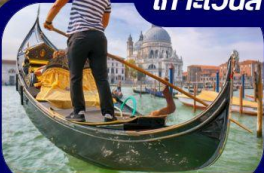
เที่ยวเกาะเวนิส

ฟรี!! ล่องเรือ Gondola เกาะเวนิส เมืองแห่งสายน้ำสุดโรแมนติก