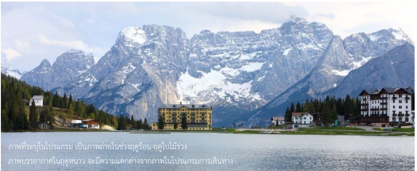
ภาพที่ระบุในโปรแกรม เป็นภาพถ่ายในช่วงฤดูร้อน-ฤดูใบไม้ร่วง

เช้า ๒๐) บริการอาหารเช้า ณ ห้องอาหารของโรงแรม จากนั้นนำท่านเดินทางสู่ เขตอุทยาน แห่งชาติเทือกเขาโดโลไมท์ หนึ่งในสถานที่ท่องเที่ยวทางธรรมชาติที่สวยงามที่สุดแห่งหนึ่งใน ประเทศอิตาลี ด้วยบรรยากาศที่สวยงามของทะเลสาบหลายแห่งและเทือกเขาหินปูนที่ สวยงามแปลกตาสูงตระหง่าน ใช้เวลาเดินทางประมาณ 2.30 ชั่วโมง จากนั้นนำท่านเดินทาง สู่ ทะเลสาบมิซูลิน่า (MISURINA LAKE) ถ่ายรูปกับทะเลสาบที่สวยงาม และเป็น เหมือนกับหนึ่งในแลนด์มาร์คที่นักท่องเที่ยวต้องมาเยือนสักครั้งหนึ่ง เป็นทะเลสาบที่หลบ ซ่อนตัวในหุบเขา ที่ถือเป็นสถานที่ท่องเที่ยวที่สำคัญอีกแห่งในโดโลไมท์